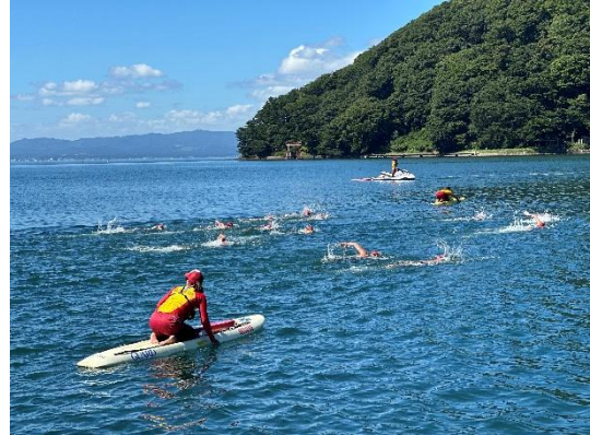
▲水泳（オープンウォータースイミング）