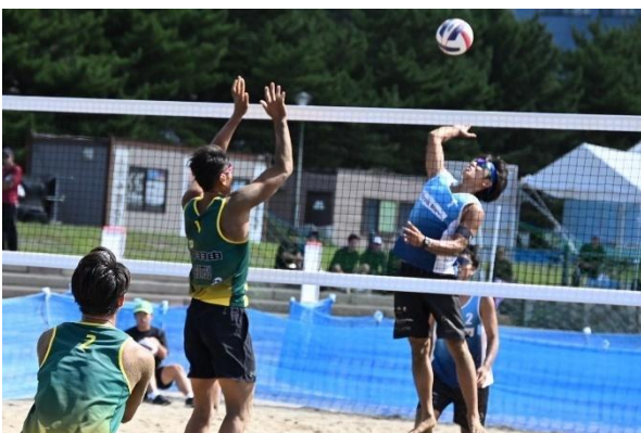
▲バレーボール（ビーチバレーボール）