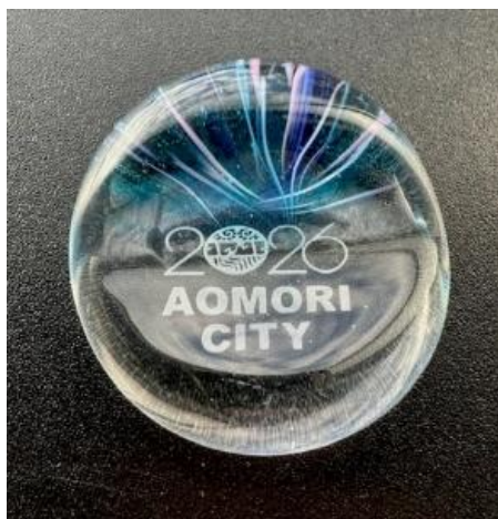
津軽びいどろ箸置き