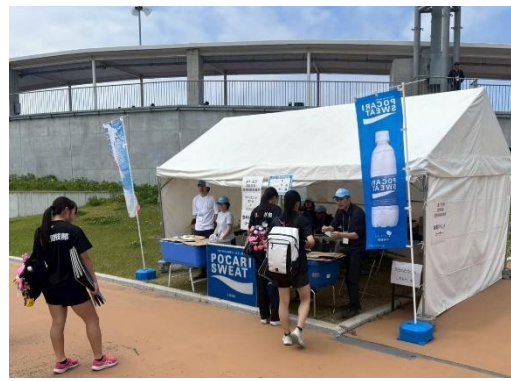
▲ドリンクコーナー