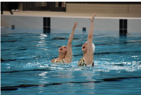
▲水泳（アーティスティックスイミング）