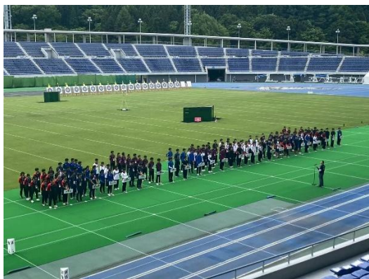
▲アーチェリー（開会式）